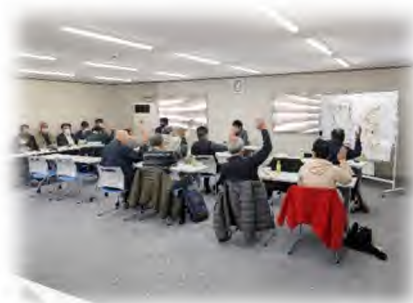
（令和7年度第2回総代会にて）